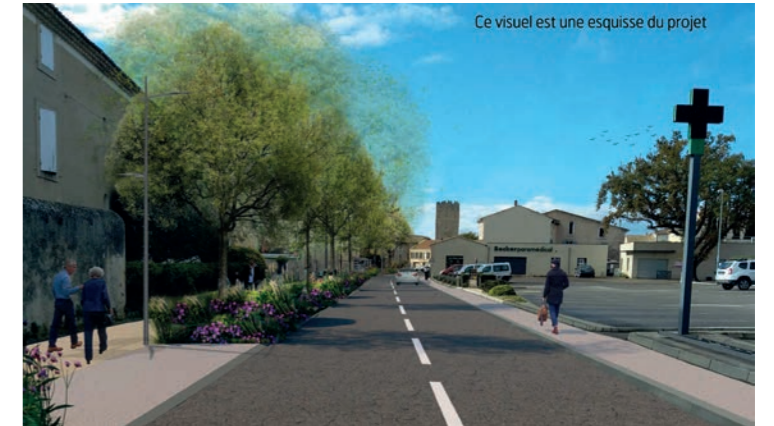
Ce visuel est une esquisse du projet

La commune a mis en place dès l'année 2020 une large concertation. Les restrictions sanitaires dues à la pandémie de Covid-19 n'ont pas permis d'organiser la concertation comme d'habitude, mais les riverains et professionnels du secteur ont pu s'exprimer en visio-conférence et également au moyen d'une plateforme numérique dédiée qui a été mise en place à l'attention de tous les usagers et de tous les Montiliens. En 2022, des réunions publiques ont été organisées afin de faire le bilan des participations et d'associer les riverains (administrés et professionnels) à l'élaboration du projet d'aménagement.