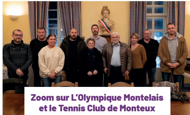
Zoom sur L'Olympique Montelais et le Tennis Club de Monteux

A Monteux il y a près de 150 associations. C'est une vraie richesse pour les Montiliens et un véritable atout pour le rayonnement de la ville. Par leurs palmarès, la diversité des activités proposées, les valeurs qu'elles inculquent à leurs membres (esprit d'équipe, éveil du sens critique, respect, vivre ensemble...) elles sont un véritable lieu d'apprentissage de la citoyenneté et de la fraternité pour les enfants, les adolescents et les adultes.