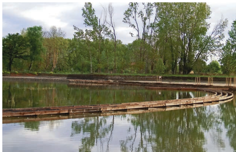
Le site en avril 2012.

Des fragments d'amulettes, des objets en terre cuite fabriqués à Millau, et différents autres objets ont également été retrouvés, lesquels ont été soigneusement inventoriés et collectés par la DRAC (direction régionale des affaires culturelles), qui en outre a autorisé la ville à recouvrir les vestiges de la ferme gallo-romaine (devant les escaliers).