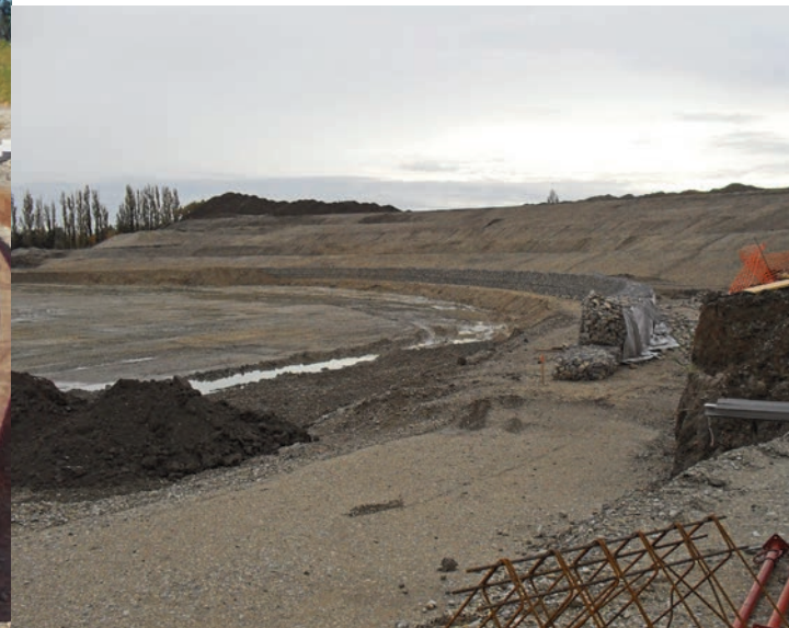
L'état d'avancement des travaux en octobre 2011.