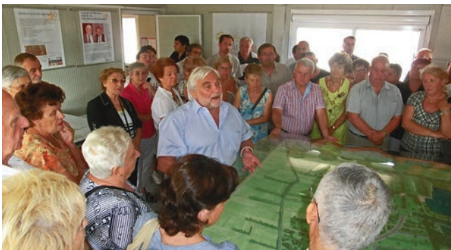
La présentation de la maquette par le maire et les élus à l'occasion de la foire d'automne en septembre 2010.

Aujourd'hui Beaulieu n'a jamais aussi bien porté son nom mais présente un tout autre visage que celui qu'il arborait il y a quatorze ans en arrière, avec ses friches agricoles. Si depuis chacun s'est approprié les lieux à sa convenance, au commencement, vouloir implanter sur ce site de Monteux un parc paysager, des plages, des pontons, une roselière, un parcours santé.... constituait un vrai pari. Le point de départ d'une nouvelle page qu'ont écrite de concert l'équipe municipale et les Montilliens qui conjuguent liberté et vivre ensemble. Désormais, Beaulieu dispose de toutes les fonctionnalités urbaines : habitat, économie, loisirs, restauration, commerce. Une mue qui a débuté en 1995. Retour sur un chantier titanesque.