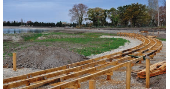
Le chantier du Lac en novembre 2012.

Porteur d'une vraie identité, indissociable de Monteux, les travaux pour créer le Lac de Monteux ont démarré en 2011 pour une ouverture au public en 2014. Un chantier gigantesque qui a nécessité des années de travail après des phases administratives qui ont duré plus d'une décennie. Un atout désormais majeur qui contribue au rayonnement économique et touristique du territoire. Cela valait bien une fête. C'est ce qu'a fait la mairie en organisant la fête du Lac, la première du nom, le samedi 1 er juin.