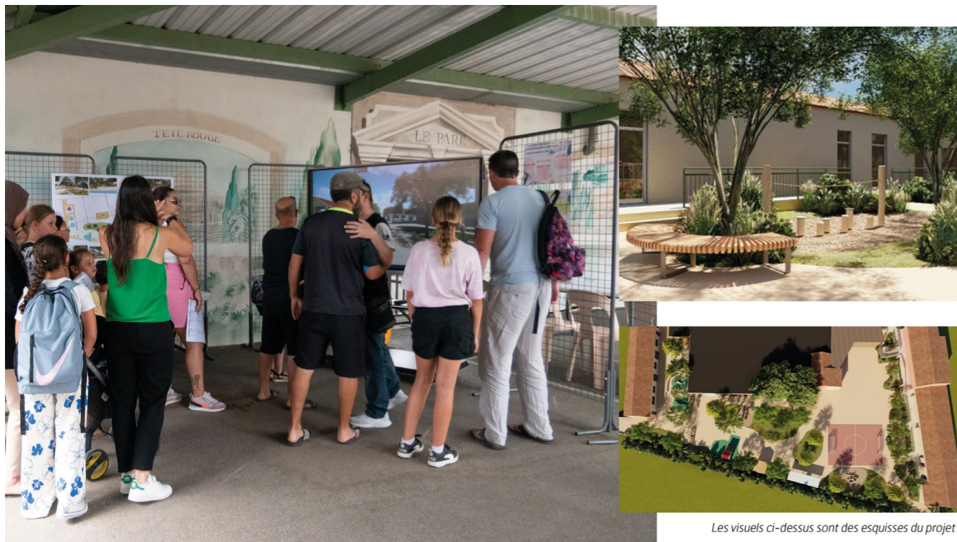
Les visuels ci-dessus sont des esquisses du projet

Avec les changements climatiques annoncés, et les vagues de fortes chaleurs, la commune a initié depuis plusieurs années un grand plan de rafraîchissement dans les écoles : installation de climatiseurs, pergola végétalisée pour offrir plus d'ombre... La commune a souhaité aller encore plus loin en transformant la cour de l'école Marcel Pagnol en cour renaturée.