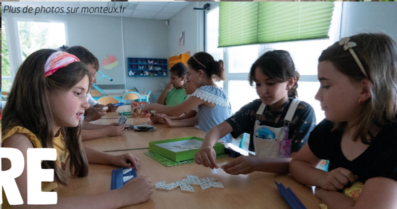
Plus de photos sur monteux.fr