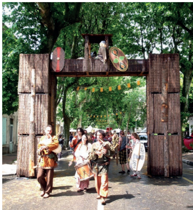
2004 a vu naître la première Légende des Siècles à Monteux : les 900 ans de St Gens. 19 ans plus tard, l'événement renaîtra !

Ensuite, une réunion mensuelle se tiendra le deuxième samedi de chaque mois, à la même heure, au même endroit. Plus d'infos sur legendedessiecles.com - 04 90 66 99 00 - contact@legendedessiecles.com