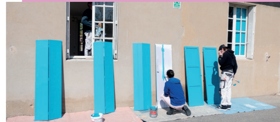
Rénovation et peinture des volets et menuiseries école élémentaire Sénateur Béraud

"Le bien-être des écoliers est au cœur de nos préoccupations. Cela passe par la qualité de l'enseignement, la qualité et la diversité des activités périscolaires, mais aussi par le quotidien. Une belle école, bien aménagée et confortable, c'est important pour que les enfants se sentent bien. Nous avons priorisé les aménagements : pour répondre aux enjeux liés à la transition écologique, les chantiers destinés à réaliser des économies d'énergie et ceux pour lutter contre les changements climatiques sont prioritaires. Je remercie l'ensemble des personnels municipaux pour leur investissement quotidien dans l'accompagnement de nos jeunes montiliens."