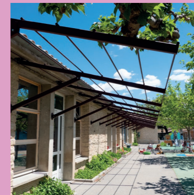
Pergola prochainement végétalisée à l'école maternelle Sénateur Béraud

Le chemin d'accès à l'école Marcel Ripert va être repris afin de sécuriser le passage des enfants et de leurs parents. En effet, les racines d'arbres ont déformé l'entrée de l'école (le parvis entre les deux portails d'entrée). Les travaux devraient avoir lieu en juillet, pour 3 semaines. Coût de cette opération : 25 000 euros.