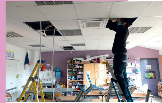
Pose d'un dispositif de rafraîchissement à l'école Lucie Aubrac