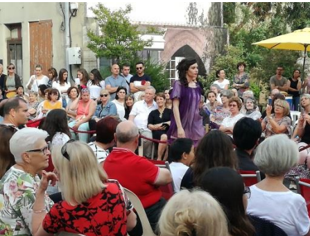
Evènementiel Défilé de mode