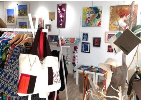
Boutique des arts