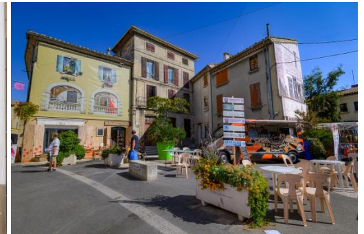
Place de la République