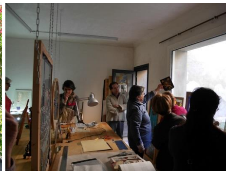
Visite d'atelier d'artiste