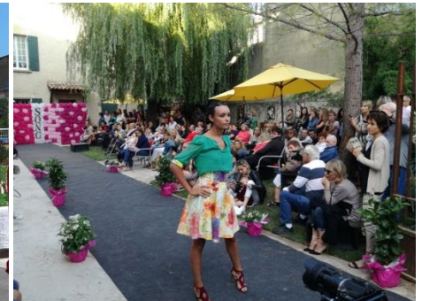
Evènementiel Défilé de mode