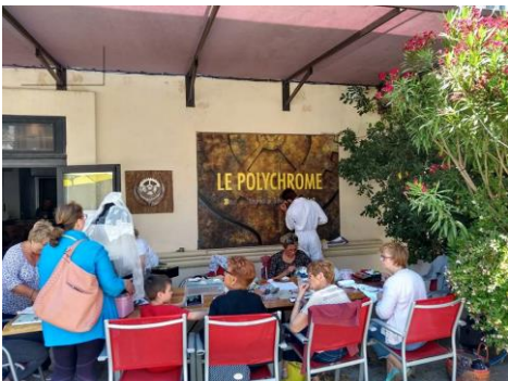
Le Polychrome – bar associatif