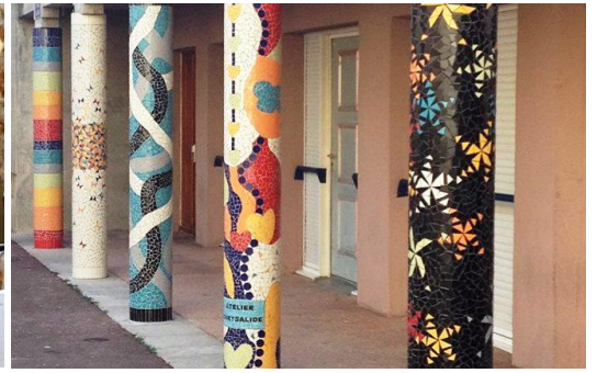
Place St Gens