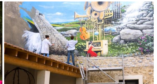
Trompe l'œil carré d'art