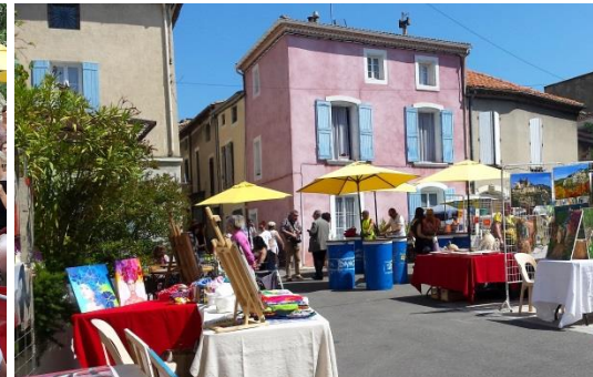
Evènementiel marché des créateurs