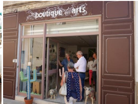
Boutique des arts