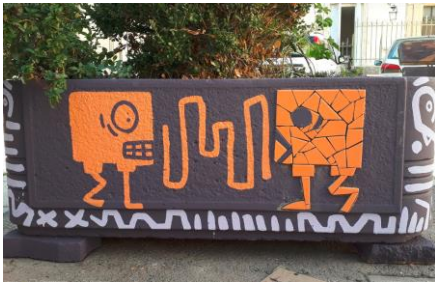
Place St Gens